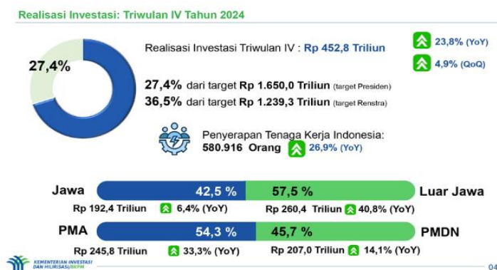
Gambar 1. 1 Realisasi Investasi Tahun 2024

Menurut hasil BKPM pada tahun 2024 dari hasil realisasi investasi sebesar 1,7 triliun telah menciptakan lebih dari 2,4 juta tenaga kerja, dengan perkiraan pada 5 tahun kedepan akan tercipta tenaga kerja mencapai 2,8 juta orang. Hasil realisasi investasi pada tahun 2024 seperti gambar 1.1.