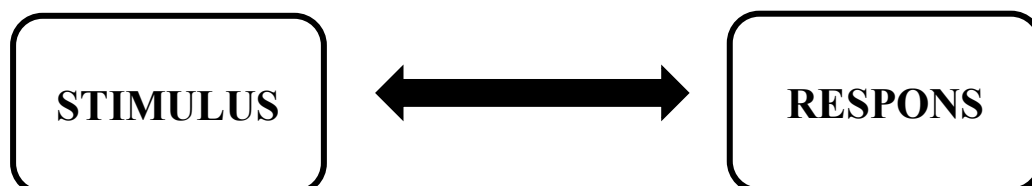
Gambar 2.1 Teori Stimulus dan Respon Sumber : Rustan dan Hakki, 2017: 101

Teori S-R adalah komunikasi linear yang paling tua (Djamal dan Fachruddin, 2015: 64). Teori S-R bisa juga disebut dengan model S-R yang dipengaruhi oleh disiplin psikologi, khususnya yang beraliran behavioristik. Model S-R dapat dikatakan sebagai model komunikasi paling dasar karena model S-R hanya menggambarkan hubungan stimulus-respons. Model ini menunjukkan komunikasi sebagai proses aksi-reaksi yang sangat sederhana (Rustan dan Hakki, 2017: 101).